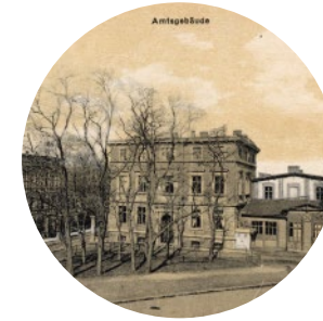
Budynek biurowy Amtsgebäude