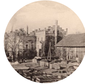
Ogródek Schloss mit Gärtnerei