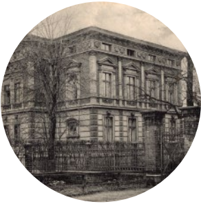
Budynek mieszkalny Villa Schlösser