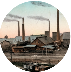
Silesia Silesia Verein Chemischer Fabriken