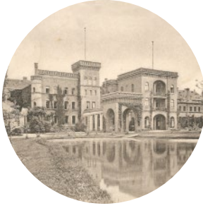
Zamek Kulmizów Schloss