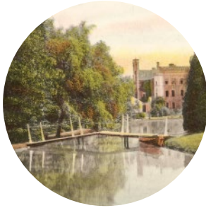
Park Schloss mit Park und Brücke