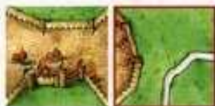
segment miasta jest kontynuowany