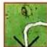
to ułożenie jest błędne

W rzadkich przypadkach, gdy wyciągnięty żeton nie może zostać położony w żadnym miejscu (nigdzie nie pasuje) i wszyscy gracze się z tym zgodzą, gracz odrzuca nie pasujący żeton (do stosu z którego go wziął) i wyciąga inny żeton.