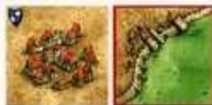
zarówno segment miasta jak i pola są kontynuowane