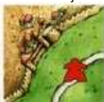
na segmencie drogi