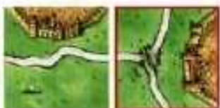
segmenty drogi i pola są kontynuowane