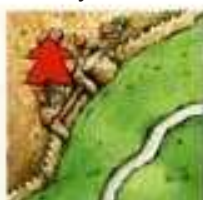
w segmencie miasta